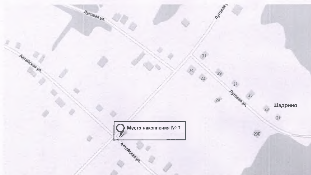
Схема мест (площадок) накопления твердых коммунальных отходов на территории муниципального образования Шадринский сельсовет Калманского района Алтайского края

Приложение №2 к постановлению администрации Калманского района от 19 февраля 2024г. № 90