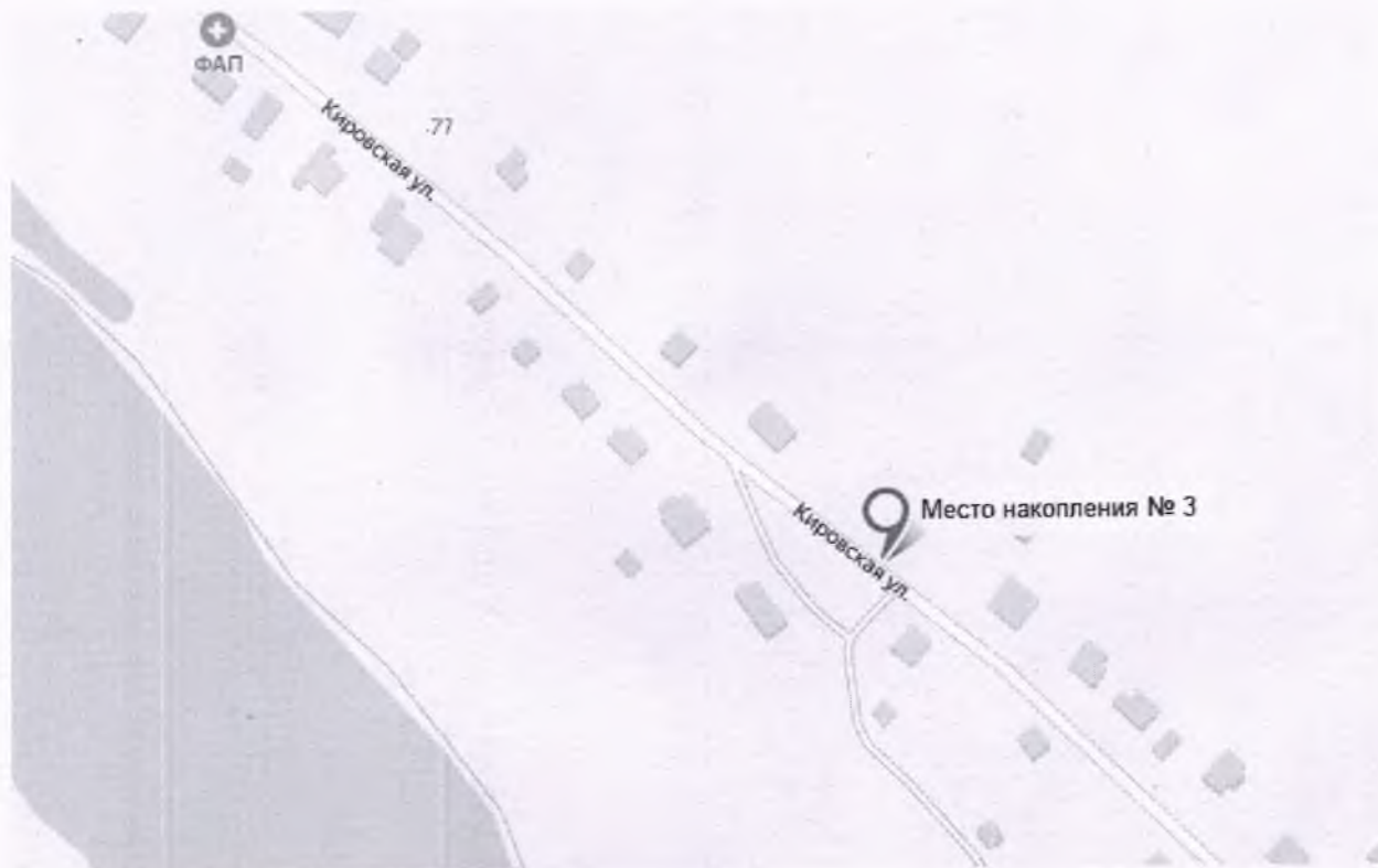
С. Шадрино, ул. Кировская, (у дома №36)