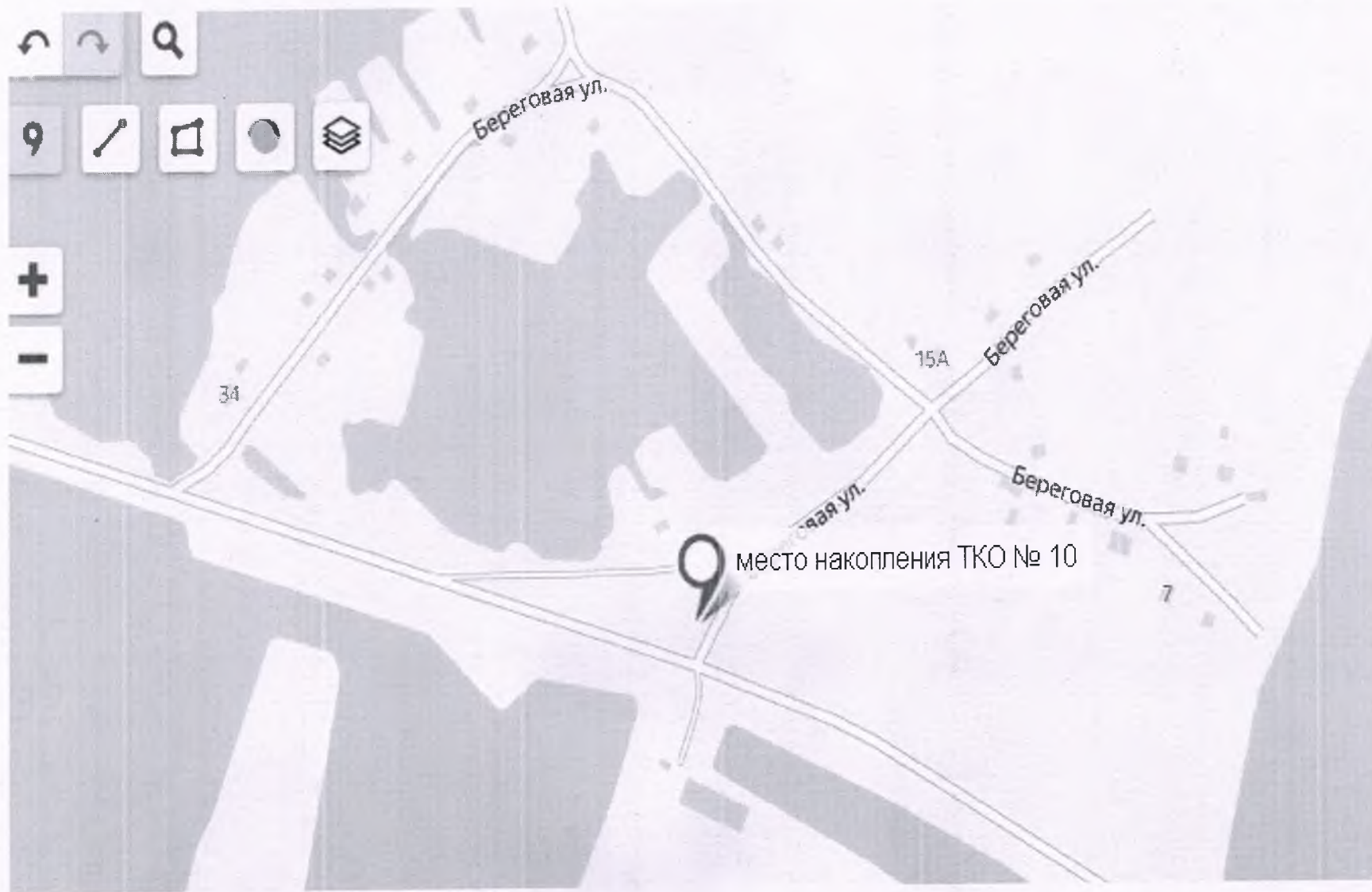
Место накопления ТКО с. Шадрино перекресток ул. Береговая