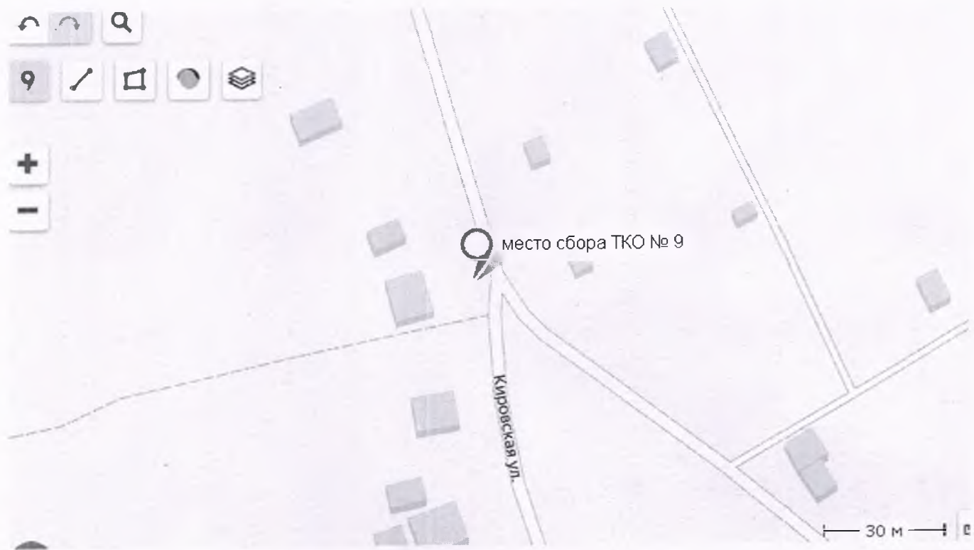
Место сбора ТКО с. Шадрино, ул. Кировская-110