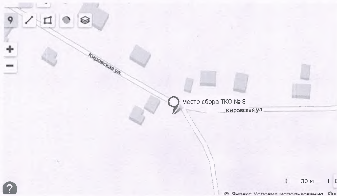
Место сбора ТКО с. Шадрино, ул. Кировская-2