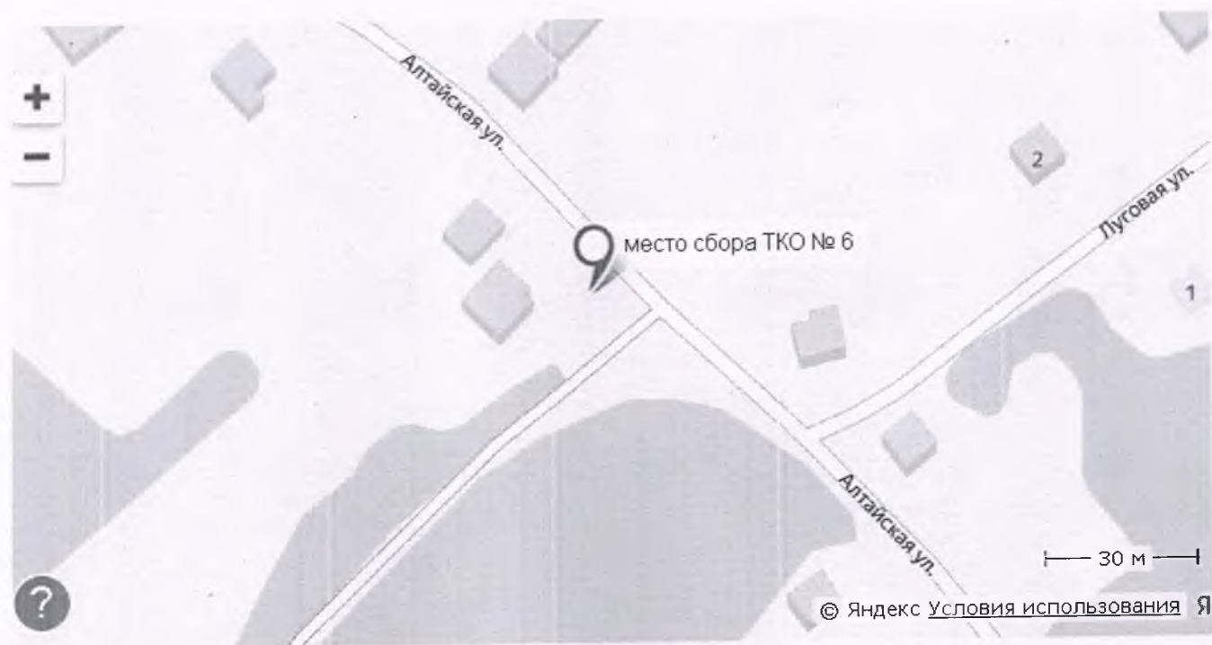
Место сбора ТКО с. Шадрино, ул. Алтайская-12