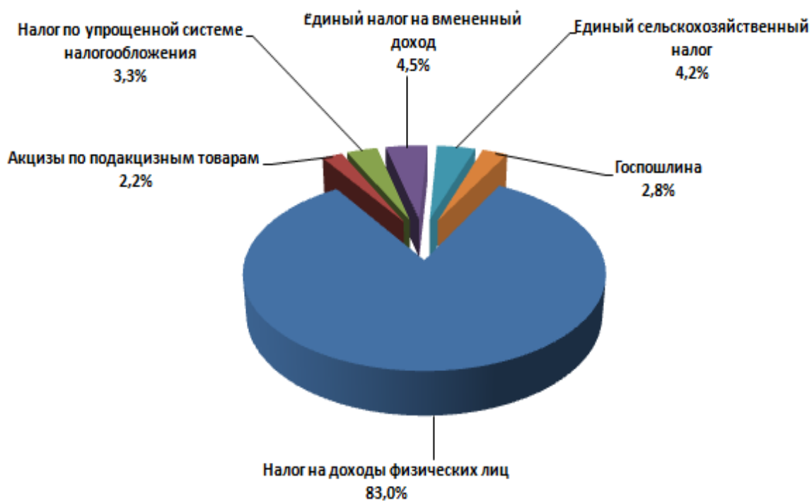
Рисунок 2 – Структура основных видов налоговых доходов районного бюджета в 2020 году