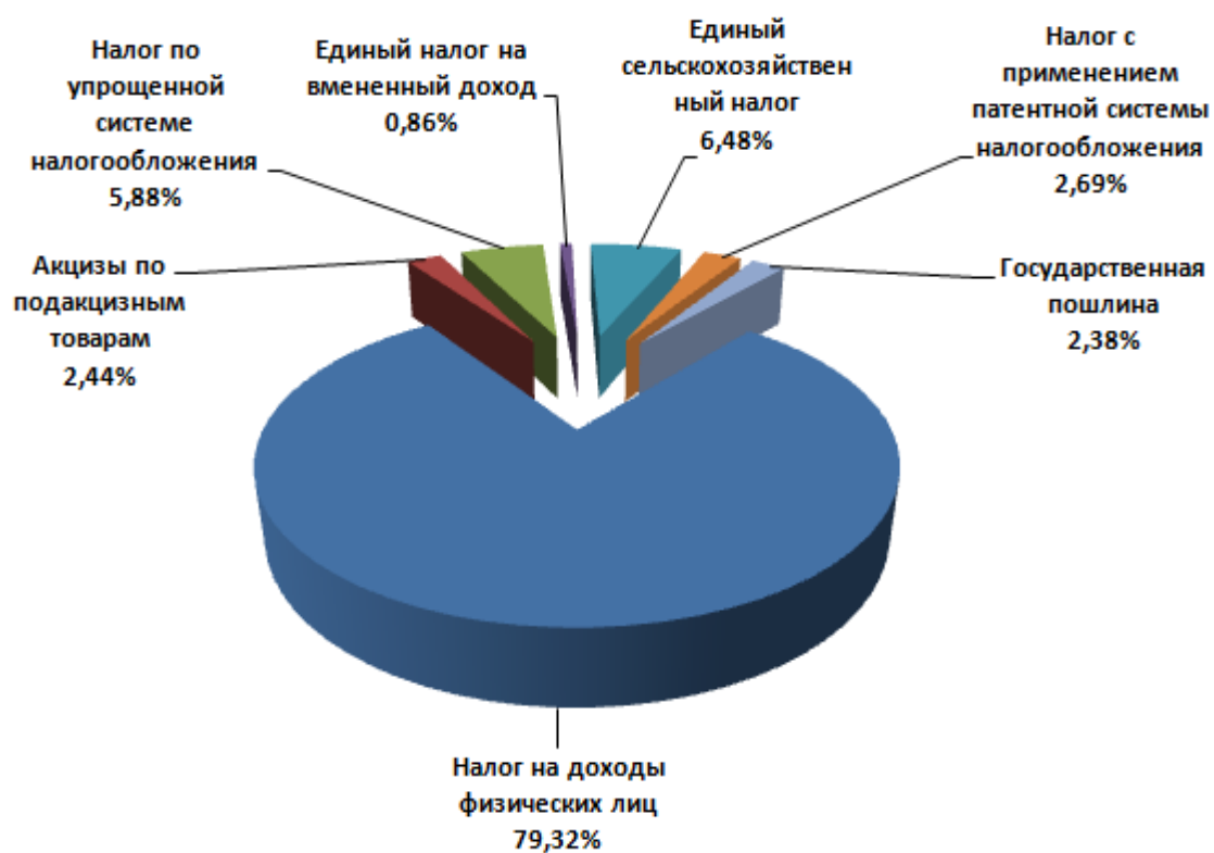
Рисунок 3 – Структура основных видов налоговых доходов районного бюджета в 2021 году