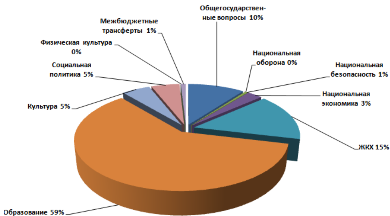
Рисунок 4 – Структура расходов бюджета Калманского района в 2020 году по видам разделов бюджета