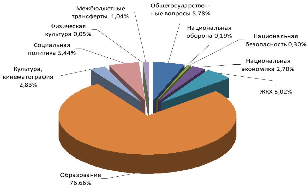
Рисунок 3 – Структура расходов бюджета Калманского района в 2019 году по видам разделов бюджета

Расходная часть бюджета, как и в прежние годы, имеет ярко выраженную социальную направленность.